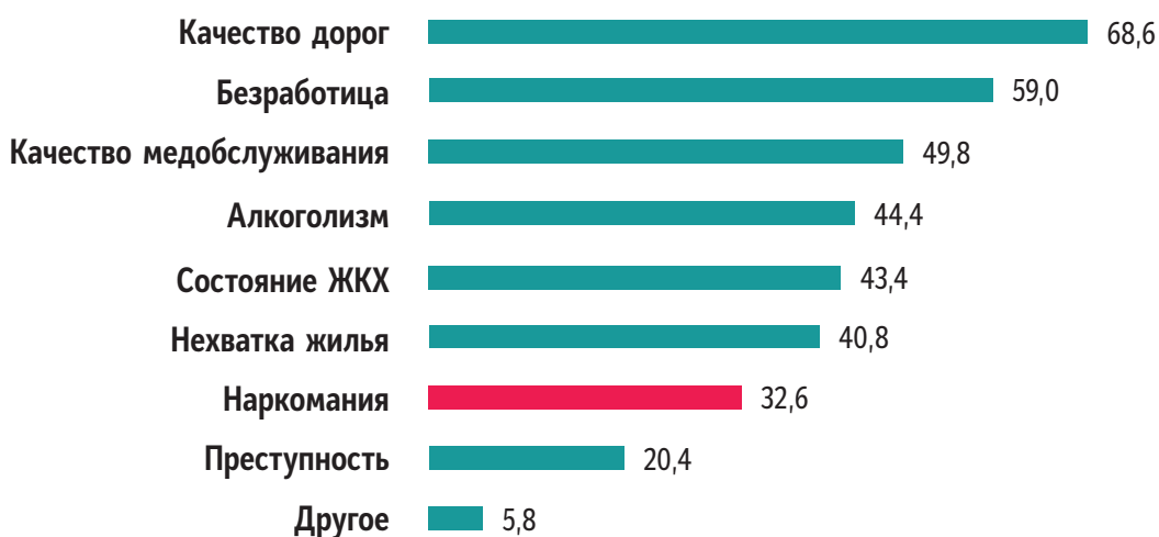
Рис. 1. Распределение ответов респондентов на вопрос: «Укажите 5 наиболее острых проблем, требующих решения в первую очередь в вашем населенном пункте», % наблюдений 1

Наиболее существенными проблемами в представлениях жителей Приморского края остаются плохое качество дорожного полотна (68,6%), безработица (59,0%) и низкое качество медицинского обслуживания (49,8%). В общем рейтинге проблем Приморского края, проблема распространения немедицинского потребления наркотических средств занимает одно из последних мест – лишь треть населения региона выражают обеспокоенность проблемой (рис. 1).