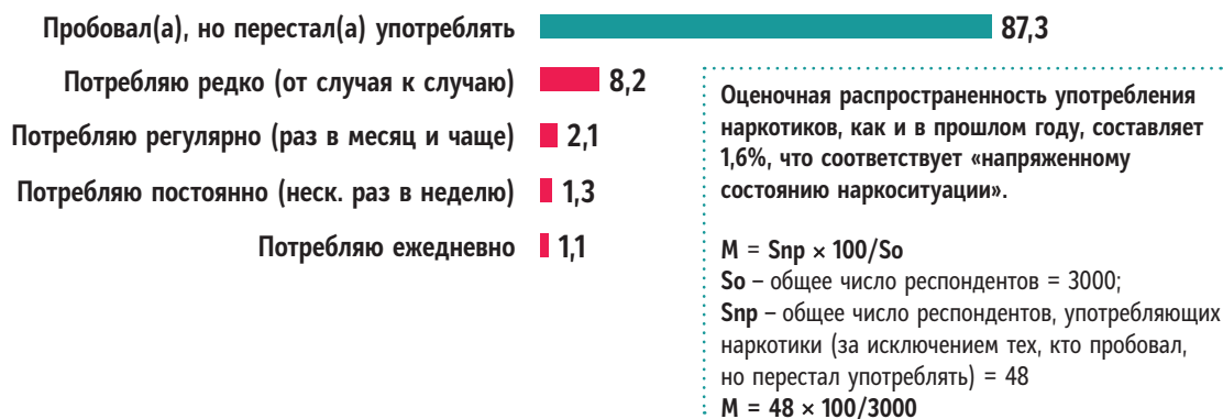
Рис. 2. Распределение ответов респондентов на вопрос: «Как часто вы употребляете наркотики?», %

Большинство их тех, кто пробовал наркотики (12,6% от общего числа жителей края), к настоящему времени перестали их употреблять – 87,3%, то есть, подавляющее число граждан, имеющих опыт употребления наркотических веществ, относятся к подгруппе случайных потребителей наркотиков. Доля актуальных потребителей составляет 12,7%.